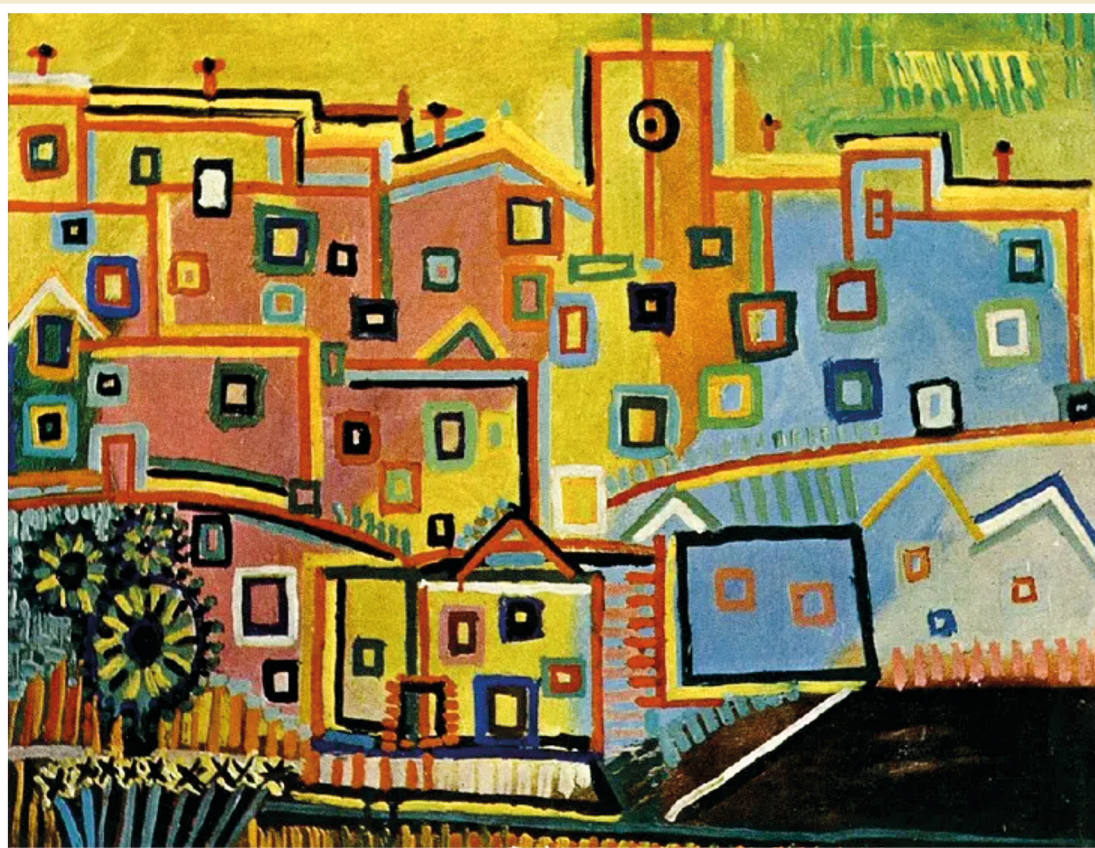
Pablo Picasso - Houses. Maisons 1937 © Succession Picasso 2023