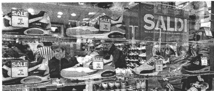
Da oggi nei negozi della Capitale inizieranno i saldi