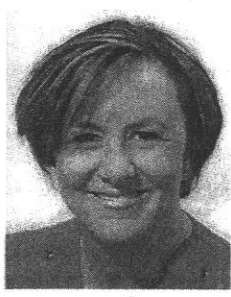
President ANACI Roma Rossana De Angelis

È questo lo scopo del Convegno straordinario organizzato dall'ANACI Roma e previsto per il 5 di dicembre presso l'Hotel Sheraton Eur di Roma. L'incontro prevede l'intervento da parte di tecnici del settore, con particolare riferimento alla figura dell'amministratore e di come questa si modificherà in base alle nuove norme che diverranno effettive decorsi i sei mesi dalla pubblicazione in Gazzetta Ufficiale del testo approvato da Palazzo Madama. "Le novità sono numerose e la figura dell'amministratore subirà una profonda modifica - ci spiega la Dott.ssa De Angelis, presidente dell'ANACI di Roma - pertanto si ritiene fondamentale una conoscenza e un approfondimento dei nuovi aspetti tecnici e giuridici che andranno a sostituire le vecchie dispo-