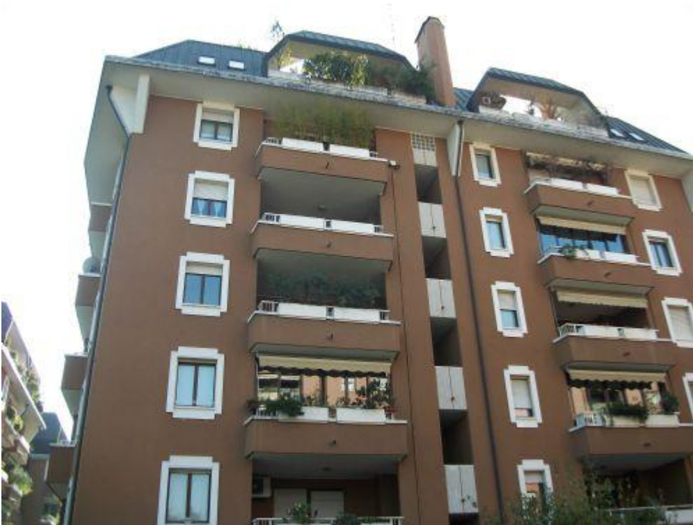
balcone a loggia