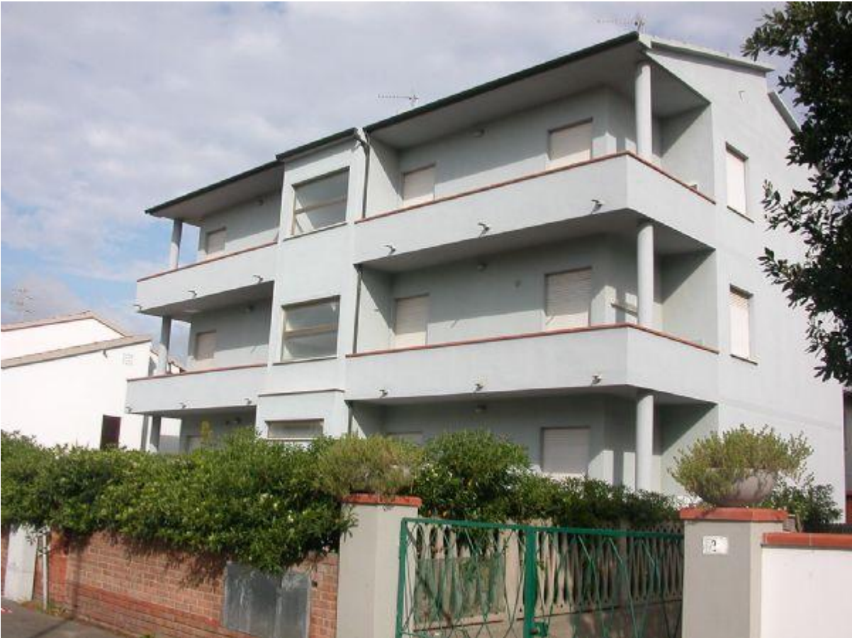
balcone a castello