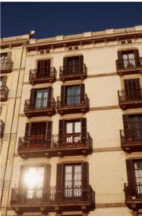
Piccola loggia a filo facciata racchiusa fra due pareti laterali intimamente legata all'unità principale